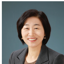
ド ミヒャン PCC KSC PCCC

現) (株)Coaching W.A.Y 代表 現) 韓国コーチ協会 理事 現) 韓国コーチング学会 理事